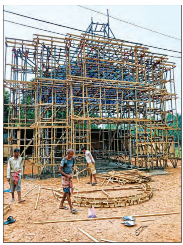
জল সরতেই ঘাটালের আড়গোড়া সংসদ পল্লীর পুজোর প্যাণ্ডেল গড়ার কাজ চলছে জোর কদমে। শনিবার