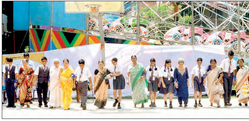
হেল্লএজ ইন্ডিয়া চেতলা সেন্ট্রাল পার্কে প্রবীণ নাগরিকদের সঙ্গে নবীনদের নিয়ে অনুষ্ঠান।

আন্তর্জাতিক প্রবীণ নাগরিক দিবস উপলক্ষে হেল্লএজ ইন্ডিয়া চেতলা সেন্ট্রাল পার্কে প্রবীণ নাগরিকদের অবদানের উদ্‌যাপন এবং আন্তঃপ্রজন্মের মধ্যে সম্পর্ক জোরদার করার বিষয়ে অনুষ্ঠান করল।