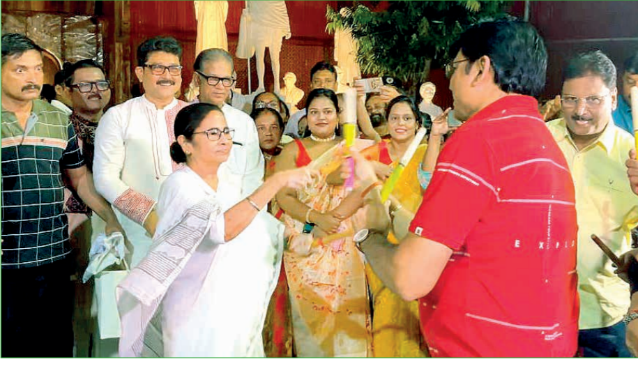
ভবানীপুর চক্রবেড়িয়া পুজোর উদ্বোধনে মুখ্যমন্ত্রী মমতা ব্যানার্জি। এলাকার বাসিন্দাদের সঙ্গে ডাভিয়া নাচে পা মেলানেন। শনিবার।