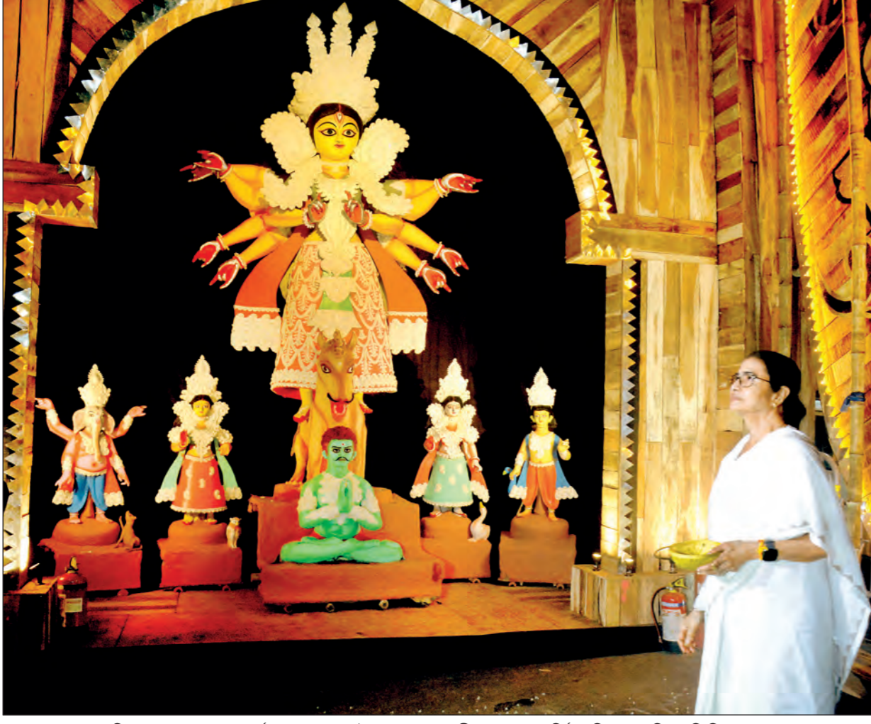
দক্ষিণ কলকাতা ফরোরয়ার্ড ক্লাবে পূজার উদ্বোধনে মুখ্যমন্ত্রী মমতা বানার্জি। শনিবার।